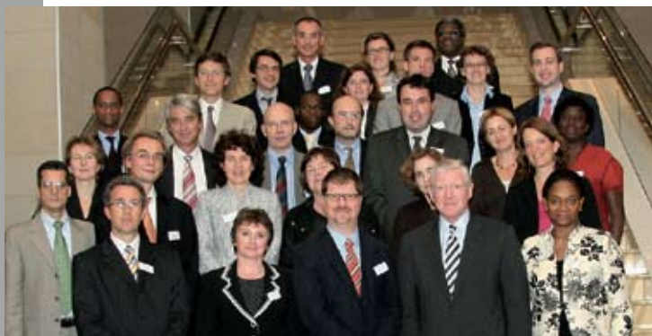
Donantes del IFFIm, miembros de la junta y personal de GAVI en la reunión de donantes del IFFIm celebrada en Ciudad del Cabo, Sudáfrica, el 27 de noviembre de 2007.