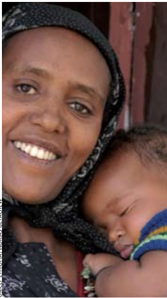
UNICEF ETHIOPIA / ANDRIAS GETACHEW