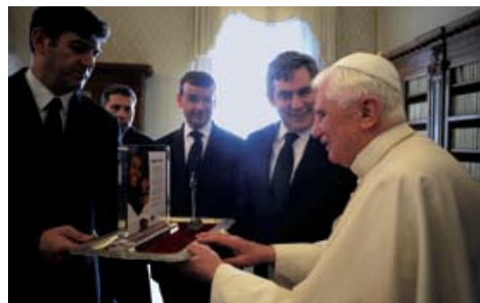
El Papa Benedicto XVI recibe el presente del IFFIm de manos del Primer Ministro británico Gordon Brown

La pequeña Brucktayet acababa de recibir la vacuna pentavalente contra la difteria, la tos ferina, el tétanos, la hepatitis B y el Haemophilus influenzae tipo B o Hib suministrada por GAVI Alliance gracias a los fondos recaudados por el IFFIm.