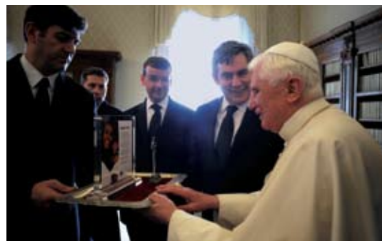
Le Premier ministre britannique Gordon Brown remet un cadeau au pape Benoît XVI